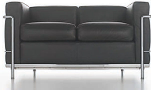
Sofa LC 2, Design Le Corbusier, Pierre Jeanneret, Charlotte Perriand (1928). Das Original produziert von Cassina.

Sie sind Trittbrettfahrer, die sich am geistigen Eigentum der Designer bereichern. Sie bewegen sich außerhalb der Legalität, und ich freue mich über alle Plagiatehersteller, derer die Justiz habhaft werden kann. Aber man kann das Ganze auch