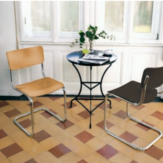
Der Freischwinger, Design Mart Stam (1931). Das Original produziert von Thonet.

Ich finde es immer wieder faszinierend, den Möbelstücken auf den Grund zu gehen. Viele der bekanntesten Klassiker stammen aus der Bauhauszeit. Mit der Industrialisierung mussten die Entwürfe einfacher gestaltet werden, denn die Möbel sollten in Serie produziert werden und erschwinglich sein. Diese Zeit brauchte ganz neue Gestaltungsansätze, und das Bauhaus gab diesen Anforderungen ein Gesicht. Die Entwürfe prägten eine Epoche, man sieht der Gestaltung und den Materialien an, zu welchem Zweck sie kreiert wurden – form follows function. Doch auch spätere Entwürfe, z.B. aus den 60er und 70er Jahren, haben sich bereits als Klassikern etabliert. Andere gelten schon heute als die zukünftigen Klassiker. Dass sie bis heute Bestand haben und noch lange Zeit haben werden, erfüllt mich mit Freude und Respekt.