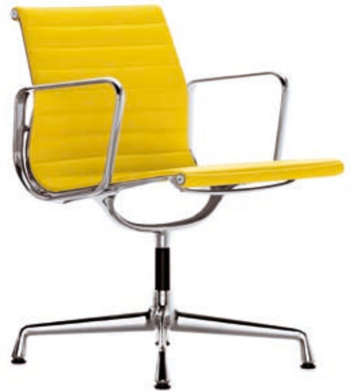
Der Aluminium Chair, Design Charles and Ray Eames (1958). Das Original produziert von Vitra.

Was sehen Sie, wenn Sie einem Klassiker gegenüber stehen?