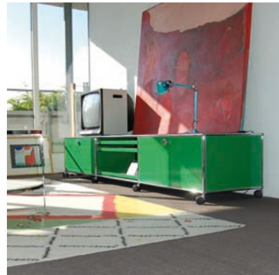
Möbelsystem, Design Fritz Haller (1962). Das Original produziert von USM Haller.

Nein, auf gar keinen Fall. Wer ein Plagiat kauft, macht sich oft gar nicht klar, dass es, wenn überhaupt, nur ein paar Jahre hält. Viele Käufer wissen nicht einmal, dass sie kein Original gekauft haben und sind unangenehm überrascht, wenn die ersten Mängel auftreten. Sie freuen sich über den niedrigen Preis, werden aber beim Kauf nicht darauf hingewiesen, dass