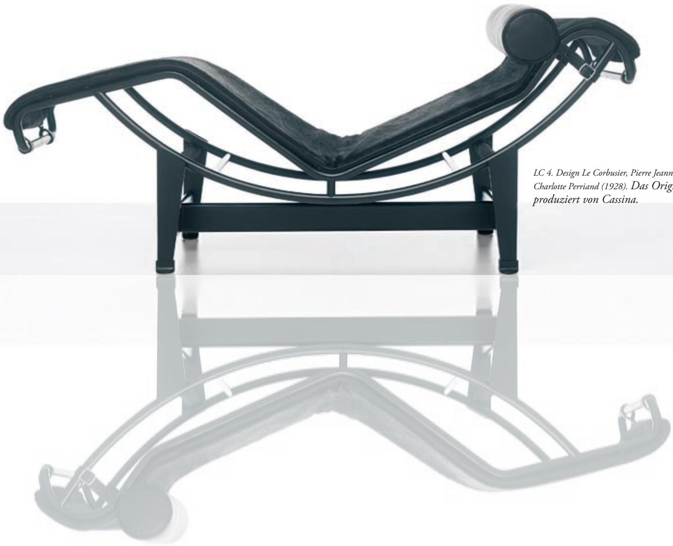
LC 4. Design Le Corbusier, Pierre Jeanneret, Charlotte Perriand (1928). Das Original produziert von Cassina.