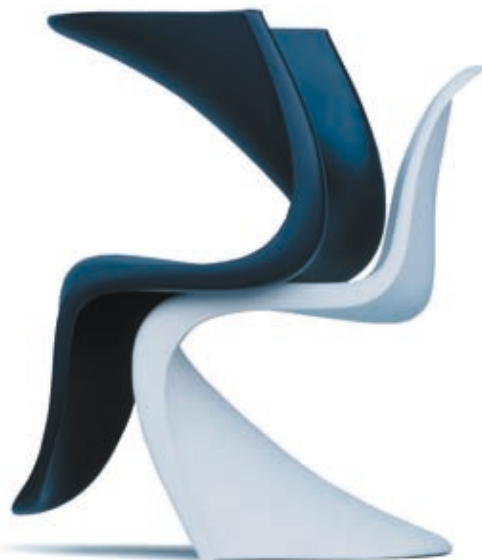
Der Panton Chair, Design Verner Panton (1959). Das Original produziert von Vitra.

Es ist vor allem ihre organische Form, die mich anzieht. Sehen Sie sich einmal diese perfekte Formensprache an. Tatsächlich ist es der Entwurf, an dem Le Corbusier am längsten gearbeitet und gefeilt hat